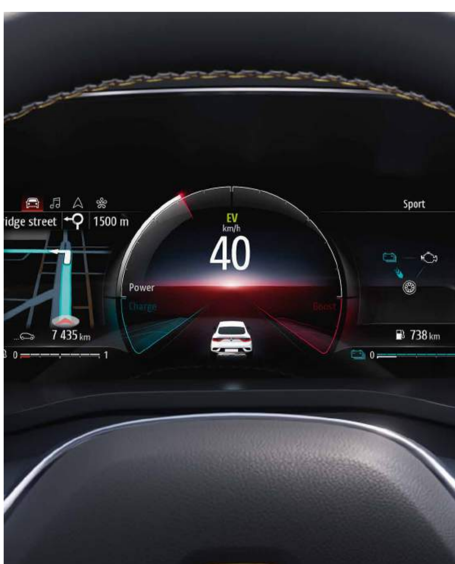
tableau de bord numérique de 10,2'' (2) avec informations de conduite