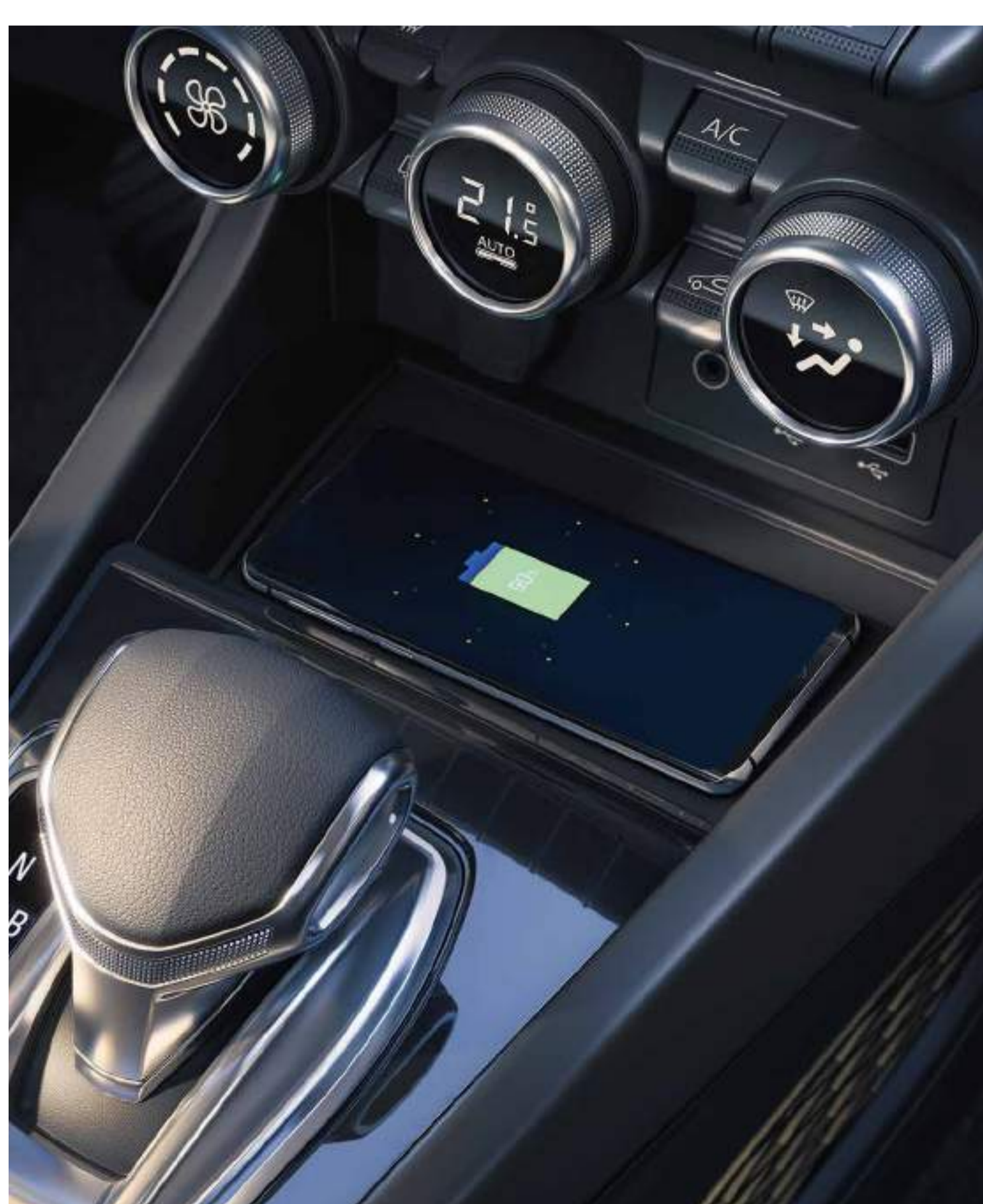
chargeur smartphone à induction