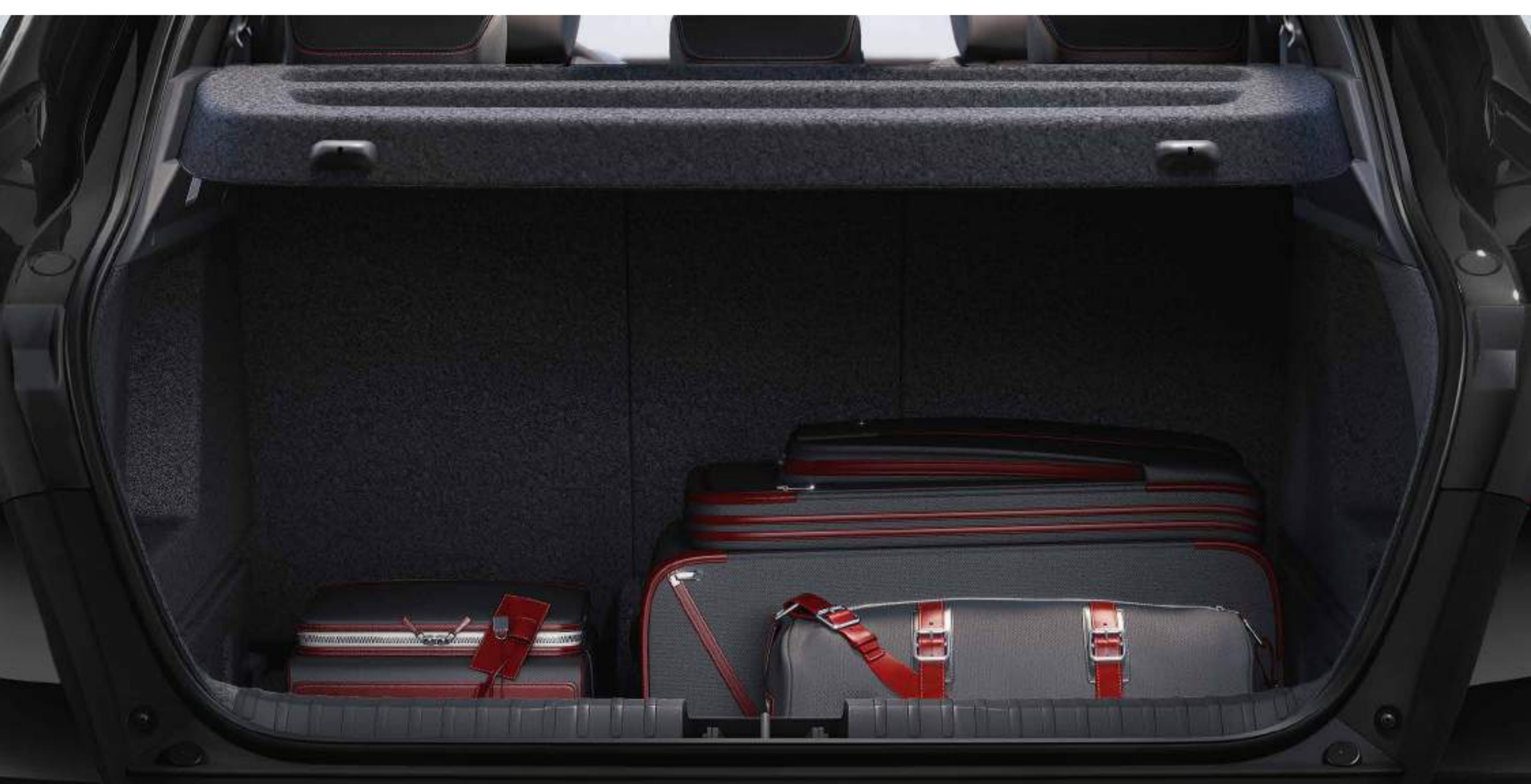
volume de coffre de 480 L

Placé en position basse, le plancher mobile maximise la capacité de chargement et en position haute facilite le chargement d'objets lourds. Une configuration qui permet également de profiter d'une surface plane, une fois le dossier de la banquette arrière 2/3-1/3 rabattu.