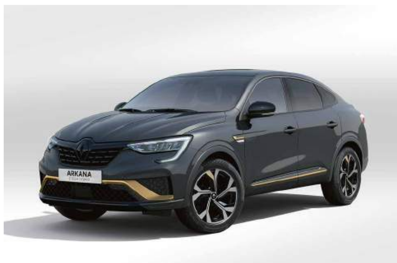
gris métallique (pm)