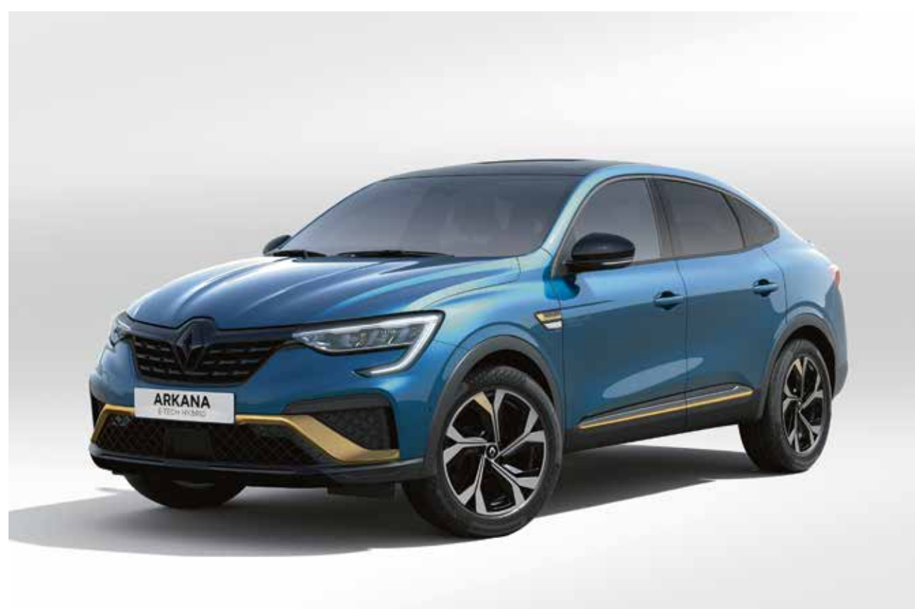
bleu zanzibar (pm)

ov : opaque verni. pm : peinture métallisée. photos non contractuelles. (1) non disponible en version E-Tech engineered.