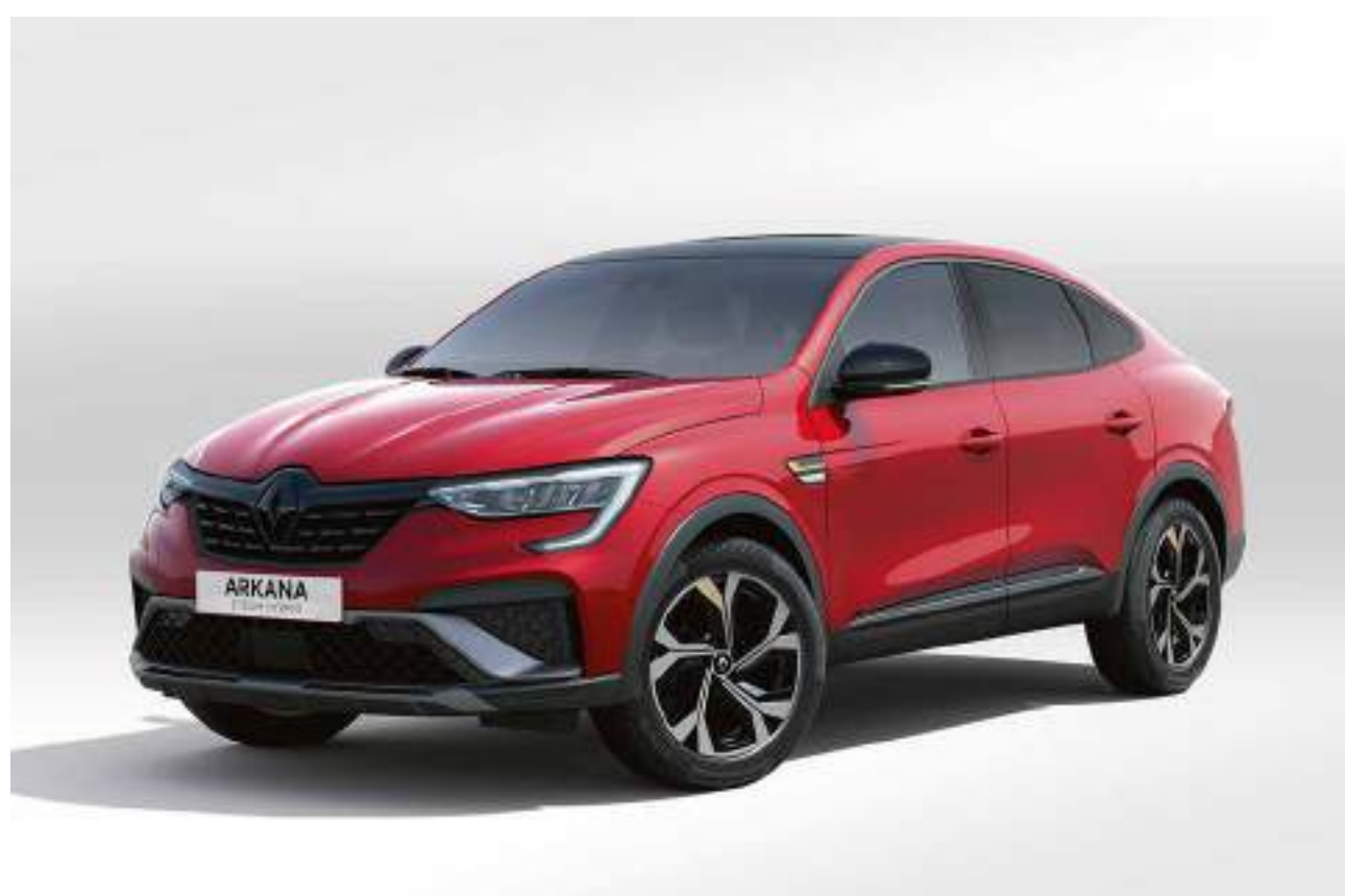
rouge flamme (pm)