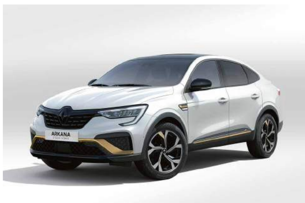
blanc perle (pm)