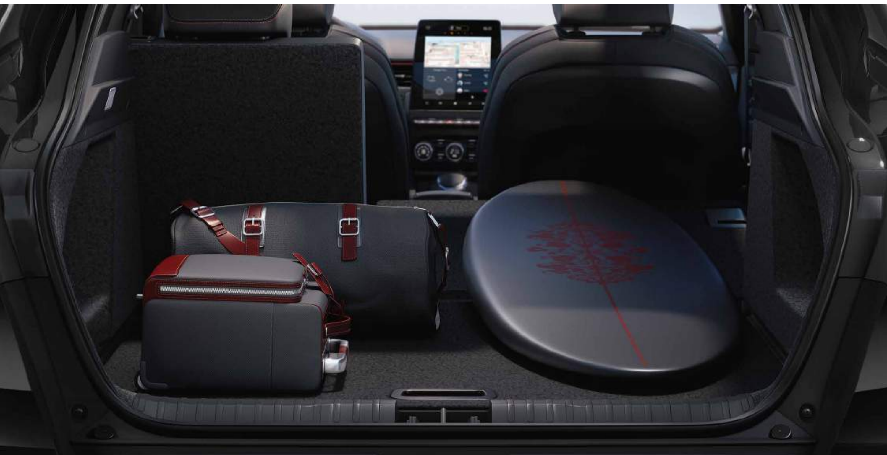
plancher de coffre amovible