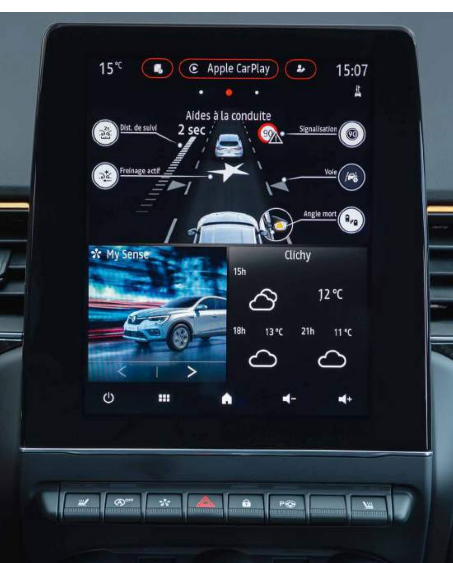
interface multi-écran : aides à la conduite, multi-sense et widgets personnalisables

Combiné au tableau de bord numérique de 10,2"* , profitez d'une des plus grandes surfaces d'affichage de la catégorie.