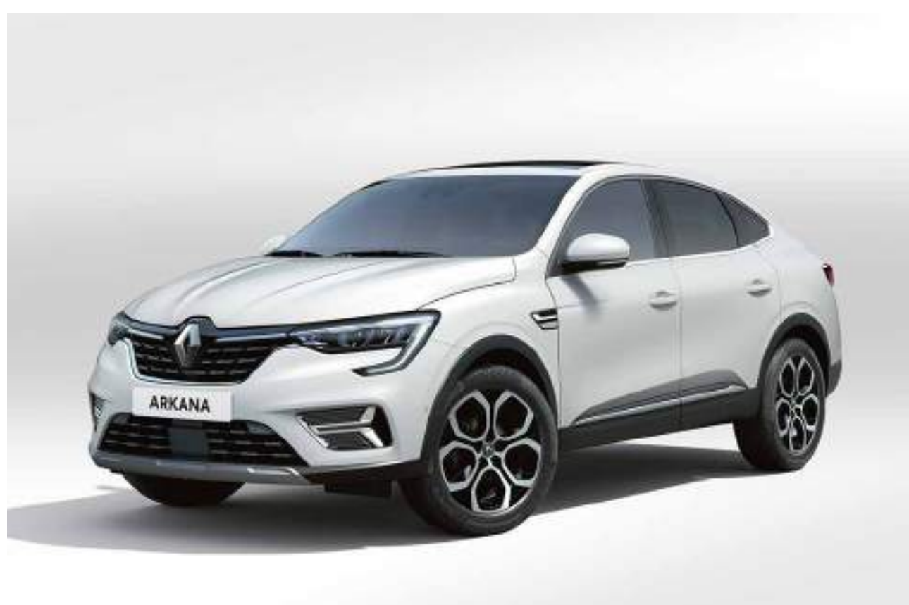
blanc opaque (1) (ov)