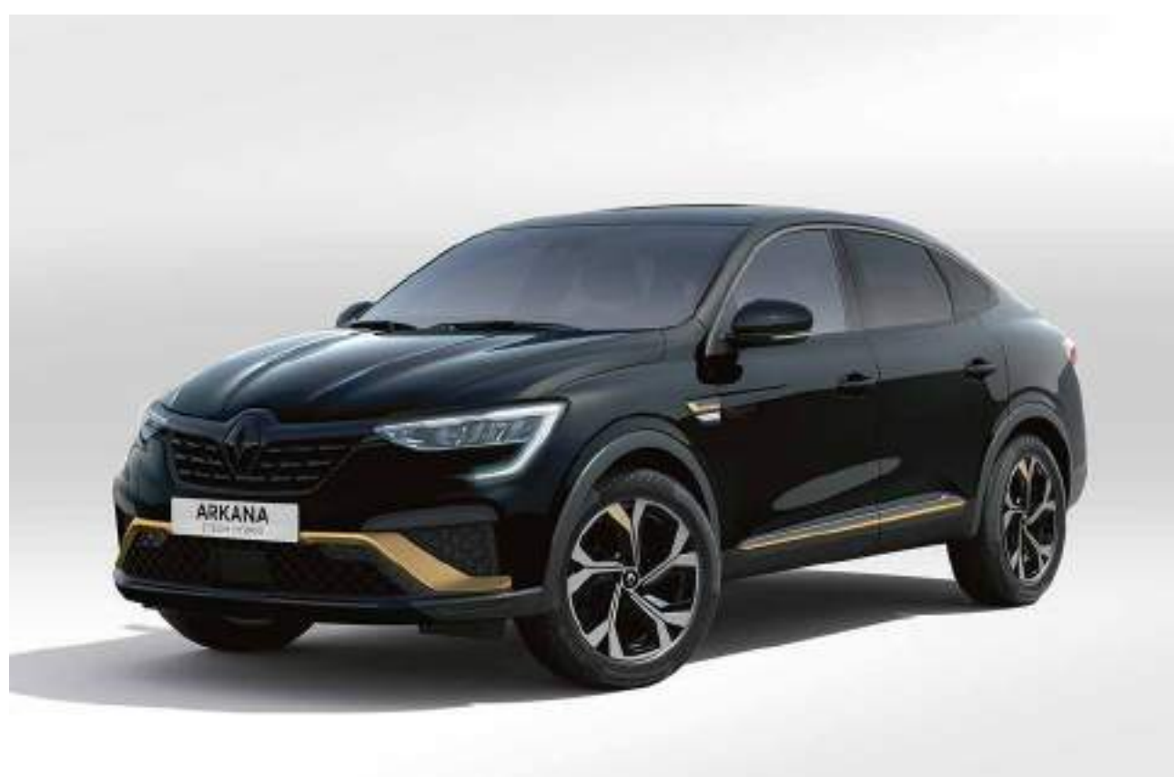
noir métal (pm)