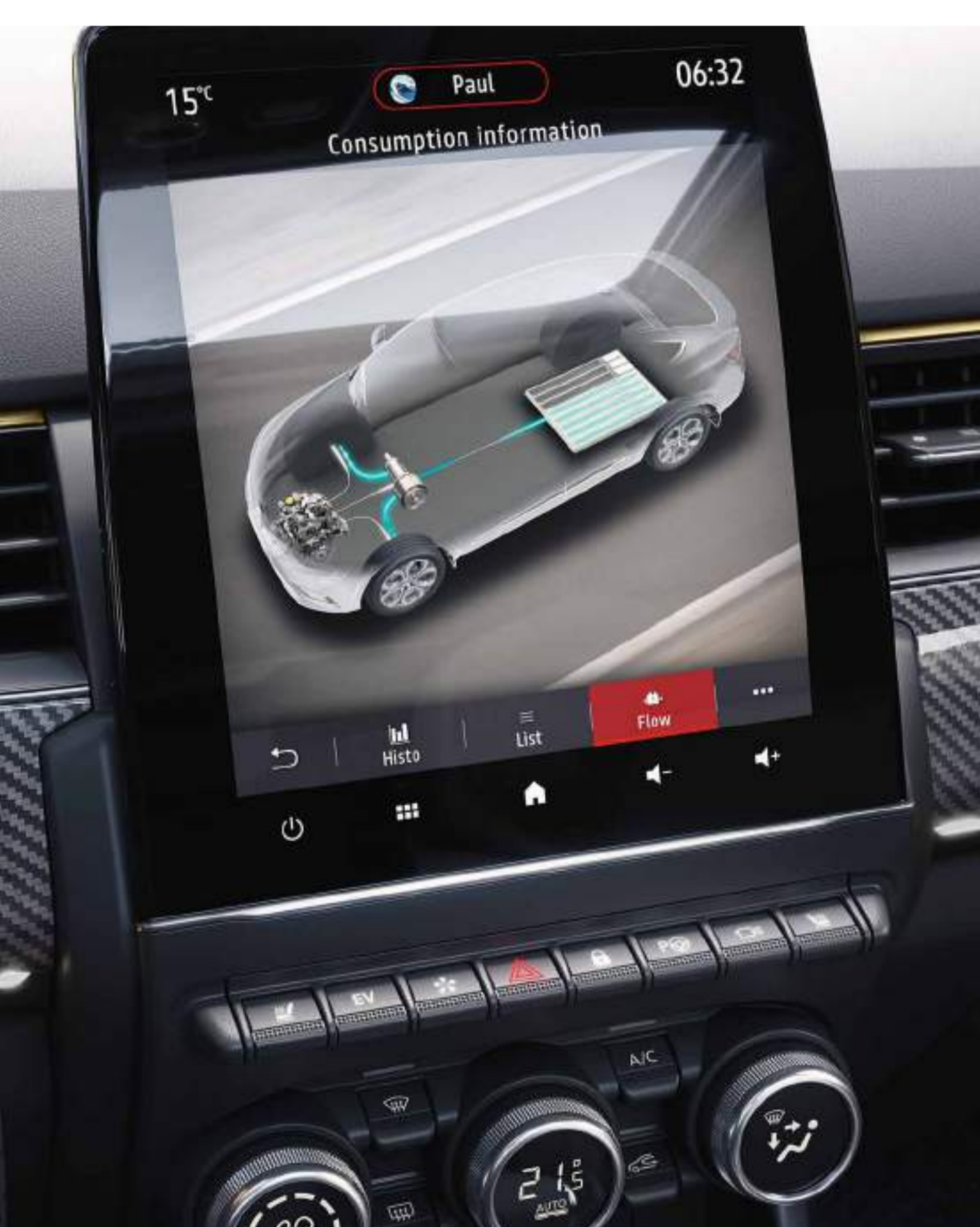
informations liées à la recharge de la batterie

Comme les démarrages se font systématiquement en électrique, les accélérations sont plus franches et dynamiques. Silence, réactivité, agilité... que vous rouliez en ville ou sur route, la motorisation E-Tech full hybrid vous apporte des sensations de conduite inédites.